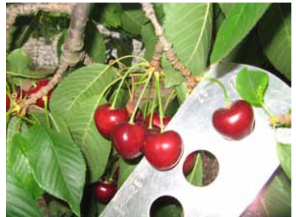
Varietà Ferrovia 28+